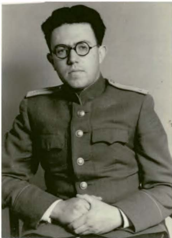
1945 г., Германия.