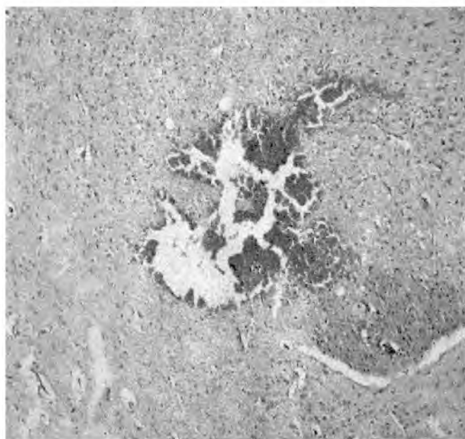
Рис. 1. Микрофотография головного мозга животных с геморрагическим инсультом. Кровоизлияние в зону механической деструкции в области внутренней капсулы. Окраска гематоксилином и эозином. Ок. 10. Об. 20

Морфологическое исследование. У животных 2-й группы (модель инсульта) выявлены типичные изменения характерные для острого периода инсульта. Они выражались наличием очагового кровоизлияния с деструкцией ткани мозга в области внутренней капсулы (рис. 1). В других от-